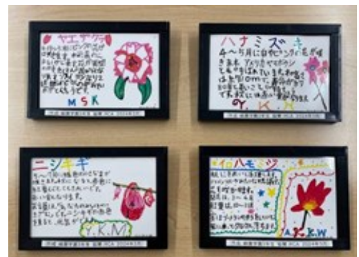
三年生の手作り樹木銘板

今年度も緑園学園3年生の総合学習の授業でRCAの活動について説明を行いました。 四季の径の緑化活動に関心が高く、今年度は1クラスだけでしたが、児童の手作り樹木銘板を作成し、一緒に設置が完了しました。