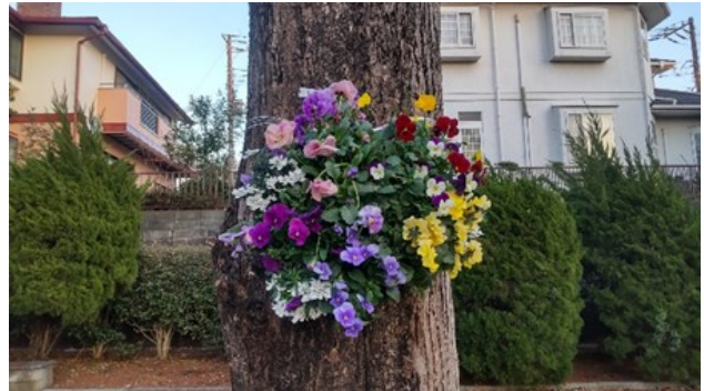
ハンギングバスケット