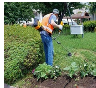
駅東口ロータリー草刈り