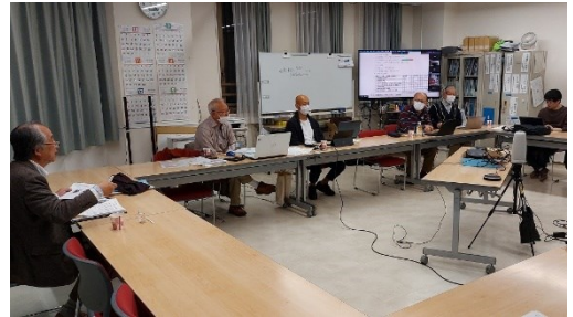
リモート対面併用理事会の様子