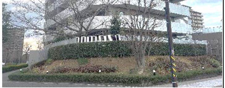
グレーシア緑園ガーデンプレミア

※一部相鉄ローゼン裏の改修工事は補助金とは別に株式会社相鉄ビルマネジメント様にて実施されました。