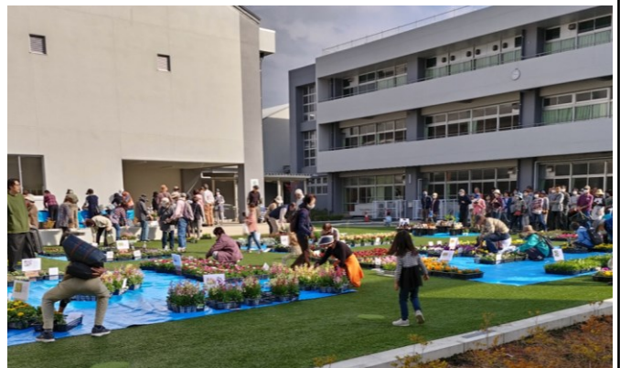
2023年 秋の花の頒布会