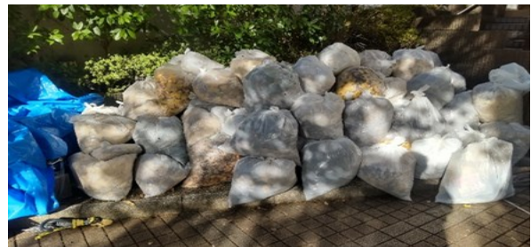
4年ぶりの一斉清掃