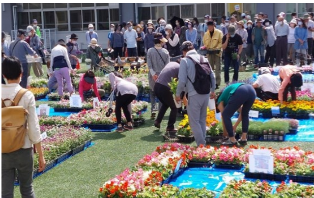
2023年 春の花の頒布会