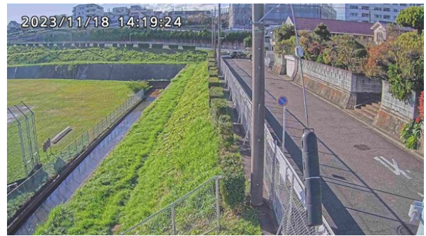
防犯カメラ映像（一丁目遊水地周辺）