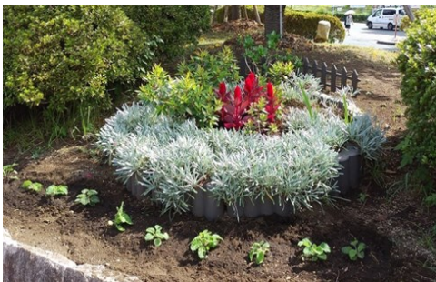
駅東口ロータリー広場