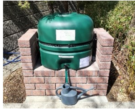
四季の径給水タンク