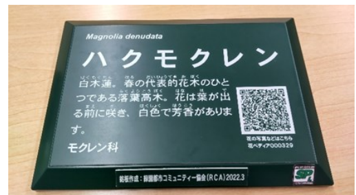
QRコードつき樹木銘板

3年間の活動で四季の径にQRコード付き樹木銘板を約150カ所に設置しました。 散歩中の皆様に大変好評です。